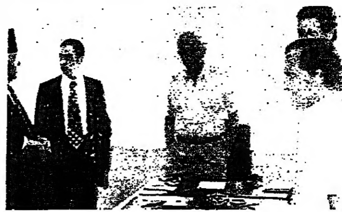
السيد كمال جنبلاط في التراسل

امضى الرئيس كميل شمعون يومه في قصر الجمهوري، وصرح مطلع وقت في الاتصال بقيادة قوى الامن في بيروت والمناطق، وفي معالجة حوادث الخطف المتواصلة.